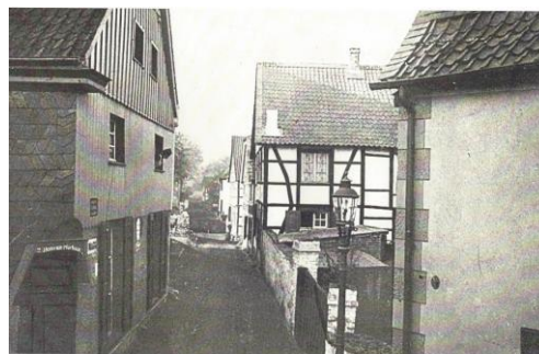
Blick in die Oberstraße um 1910